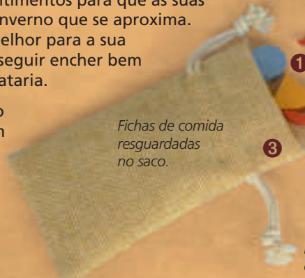
Fichas de comida resguardadas no saco.

Ratzzia é um jogo de dois a cinco jogadores. Os dados representam os ratos na família de cada jogador e vamos ter que organizar cada lançamento colocando os diversos resultados dos dados no tabuleiro, para assim conseguir acumular tanta comida quanto possível.